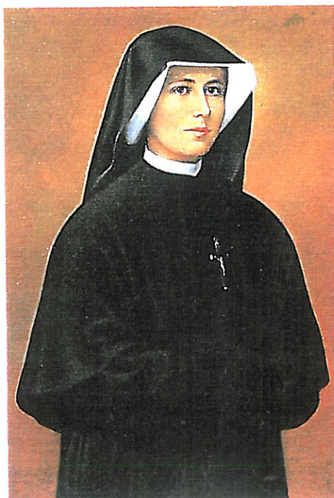
Santa Faustina Kowalska Apóstol de la Divina Misericordia